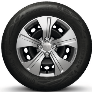
15-Zoll-Stahlrad mit Radvollblende Elma