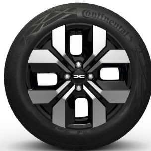
16-Zoll-Leichtmetallrad Randia, glanzgedreht